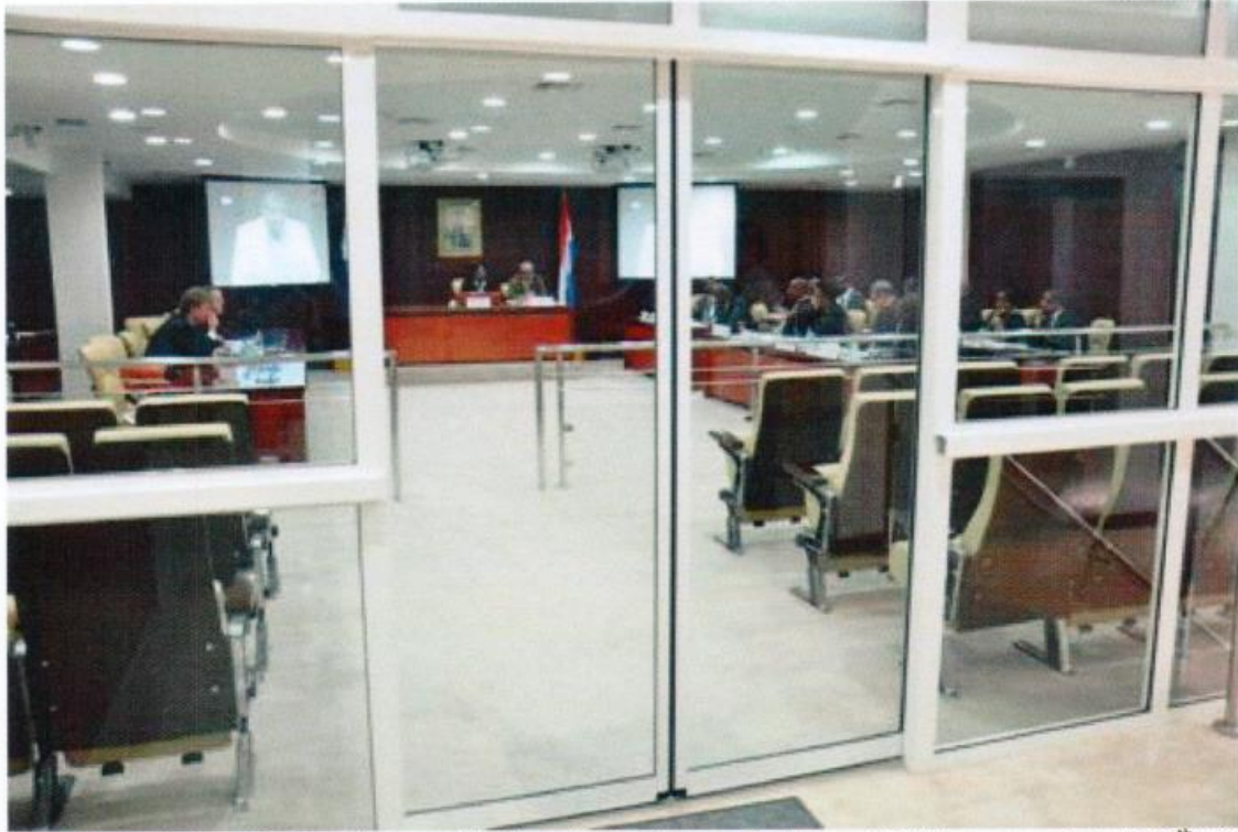
The brand new high-tech General Assembly Chamber in the new Parliament Building opened April 28 th , 2011.

Some MP's worked from their homes. The Parliament Building was finally ready to be occupied and an official opening of the offices marked this fact on April 28 th , 2011.