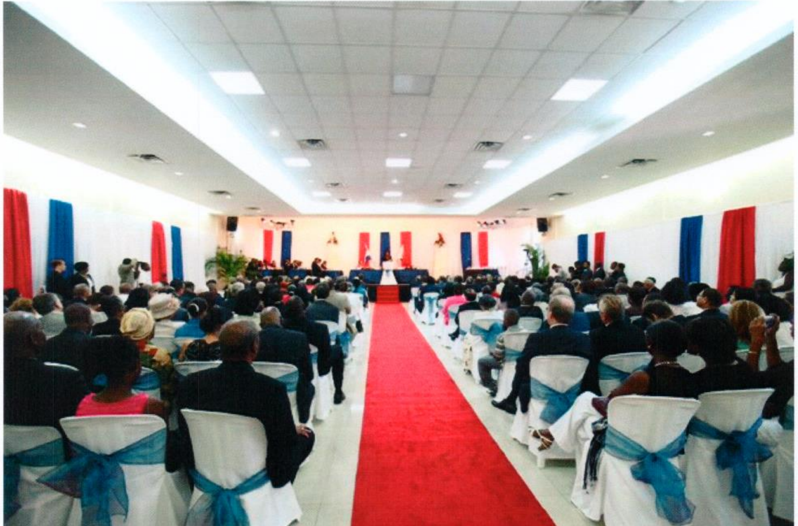
On Sunday, October 10 th , 2010, the Belair Community Center was converted into a temporary ceremonial chamber of Parliament Sint Maarten.

This first Annual Report of the Parliament of St. Maarten is part guide and part report. It gives a brief overview of the past year's activities, the challenges faced and the objectives of the next Parliamentary Year 2011-2012. The Introduction features the start of the swearing in process of the installation of the different entities of government for Country St. Maarten on October 10 th , 2010.