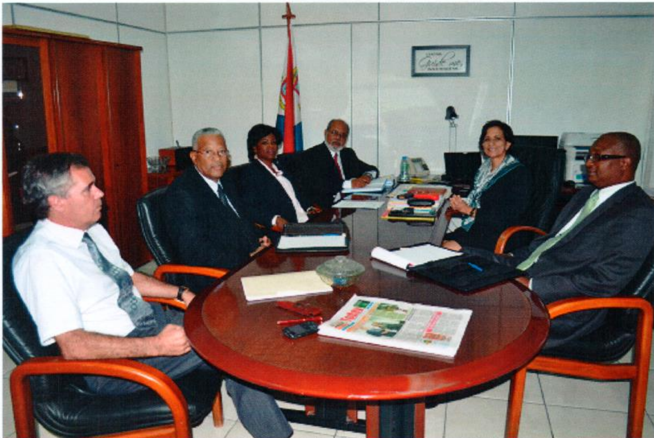
On Thursday, August 4 th , 2011, President of Parliament, drs. Gracita Arrindell, met with the Honorable Prime Minister, Sarah Wescot-Williams and the staff of the Department of Legal Affairs in regards to the ongoing legislative process.

Some personnel have been recruited from the former island government. The regulations governing personnel, namely the 'Landsverordenening Materieel Ambtenarenrecht' (LMA) governing the legal position of personnel, includes an Article 113 that basically states that any civil servant wishing to work for Parliament will have to resign their government job. This caused considerable delays in finalizing the official appointment of the Parliament staff, including the faction staff 7 . This issue was discussed with the Ministry of General Affairs. A permanent and legal solution must be sought through the amendment of this article.