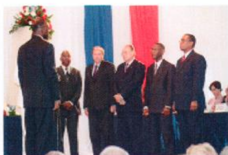
Council of Advice 2

Other institutions of government are the Council of Advice, the General Audit Chamber and the Ombudsman.