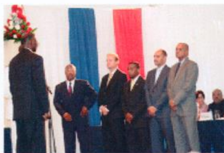
General Audit Chamber 3