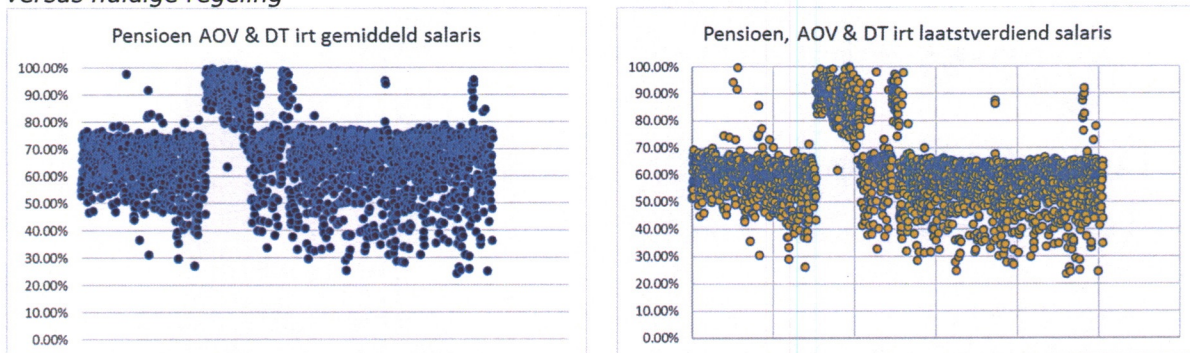
Tabel 11: vergelijking te bereiken totale pensioen (inclusief duurtetoeslag en AOV) nieuwe regeling versus huidige regeling

Het verruimen van de maximale pensioenopbouw is in het voordeel van de (nog) actieve deelnemers in de zin dat ze over een langere periode pensioen kunnen opbouwen dan voorheen.